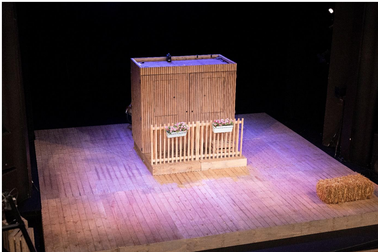
Slika scene 1